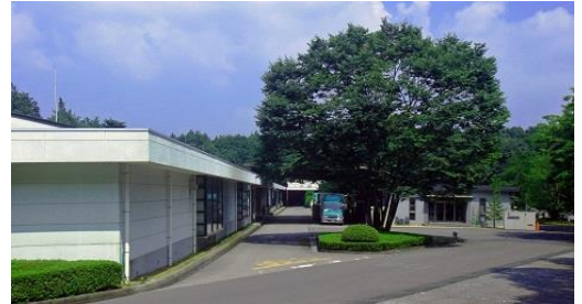
(根室工場外観写真)

当社は日光市に拠点を持つEMS(電子機器の製造・組立)及び光学機器の組立メーカーです。ぜひ一度当社にいらして、仕事内容を理解していただくとともに、会社の雰囲気を感じ、生の声を聞きに来てください！